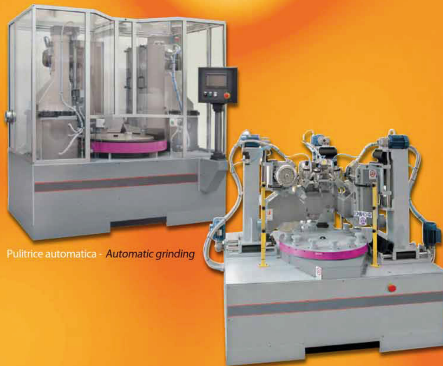
Pulitrice automatica - Automatic grinding