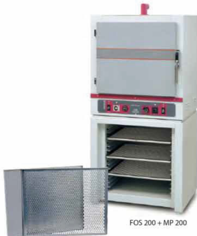
FOS 200 + MP 200

The enamel dispenser DIS can be fitted with a wide range of syringes (10-30-60 cc) connectors, joints and needles (from 0,5 to 1,6 mm diameter) for the various applications. The piece of equipment is completed with 3 enamelling paddles: inclined, straight and L shaped.