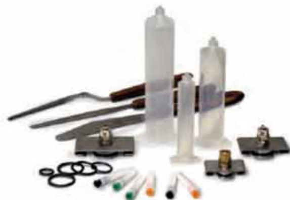
Kit siringhe - Kit of syringes